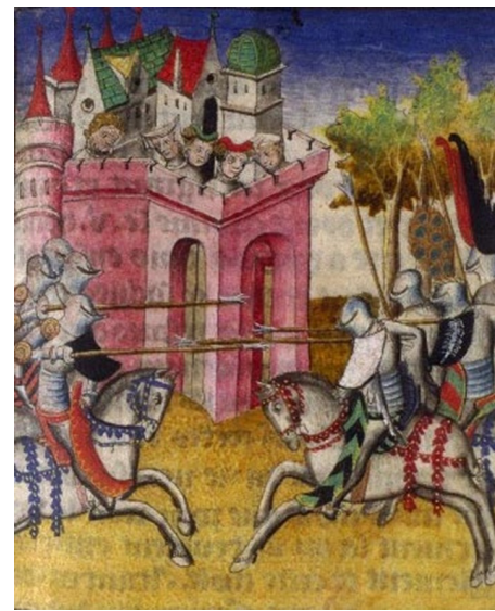
Tournoi du Chastel aux Puceles

Au château, le seigneur organisait des grands banquets. Il mangeait la viande rapportée de la chasse. Il dansait, il discutait, il écoutait les récits des trouvères ou des troubadours et la musique des ménestrels.