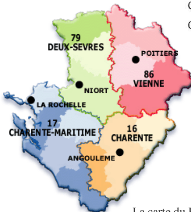
La carte du Poitou-Charentes

Les régions sont de tailles très inégales. La région Nord-Pas-de-Calais ne regroupe que deux départements alors que la région Rhône-Alpes en regroupe huit. L'Île-de-France est quarante-cinq fois plus peuplée que la Corse.