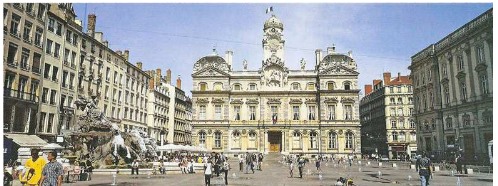
L'hôtel de ville de Lyon →

Le centre historique est souvent un quartier animé (commerces, restaurants, bars...) ou un quartier de bureaux où les administrations sont nombreuses.