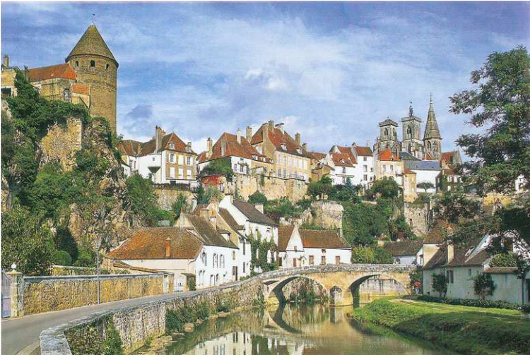
↑ Le centre-ville de Semur-En-Auxois

Le centre regroupe de nombreuses activités (mairie, banques, musées, lieux de culte). Dans les zones piétonnières ( Doc. 1 ) et les galeries marchandes, les commerces sont variés.