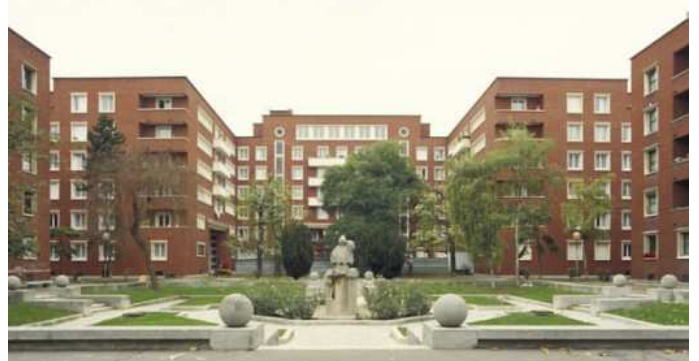
Cité-square Dufourmantelle, Maisons-Alfort ↑

Dans les quartiers d'habitation, on trouve quelques commerces (boulangeries ou épiceries...) et des services utiles à la vie quotidienne (médecin, poste, banque...).