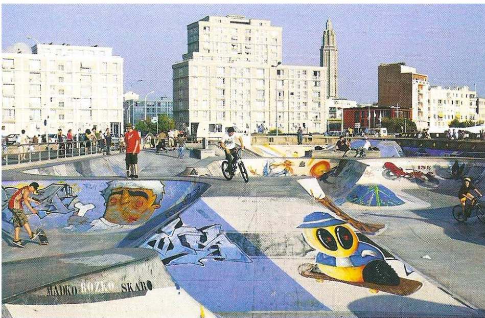
← Un quartier du Havre et ses habitants

Chaque quartier est un espace qui a son propre rythme de vie : par exemple, les quartiers résidentiels* sont souvent vides le jour tandis que les zones* commerçantes sont animées. Le quartier est un espace de vie