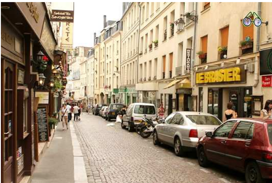
↑ La rue Mouffetard à Paris

La rue est un espace familier pour ceux qui la fréquentent.