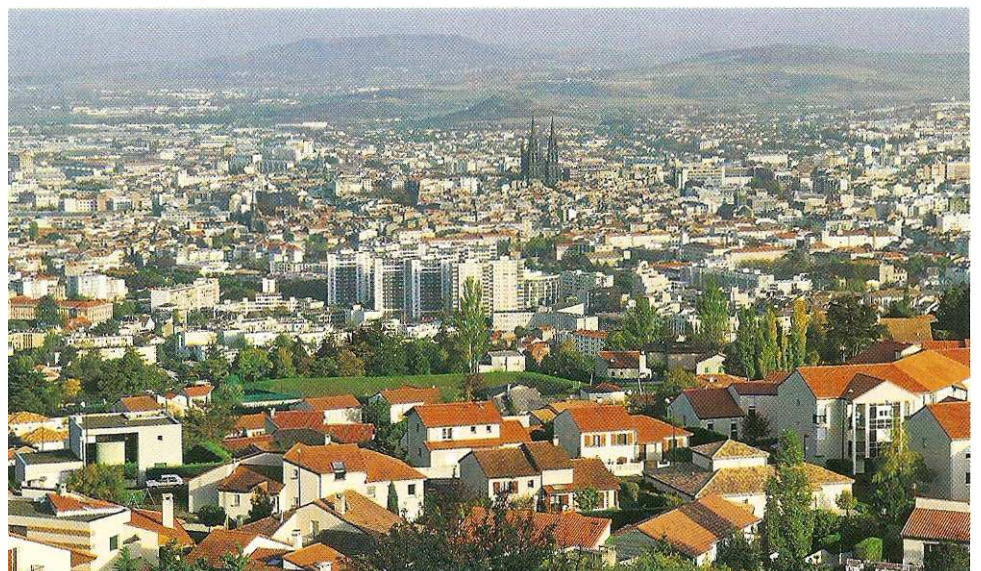
→ Les différents quartiers de la ville de Clermont-Ferrand.