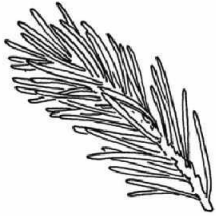
aiguilles de conifère

Les feuilles peuvent être entières ou découpées en plusieurs parties, être dentelées ... Certains fruits sont comestibles , d'autres non.